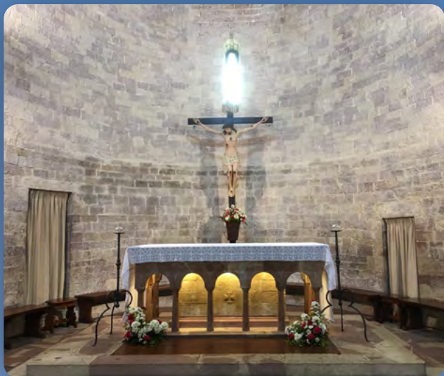
Sanktuarium Ogołocenia w Asyżu, ołtarz główny